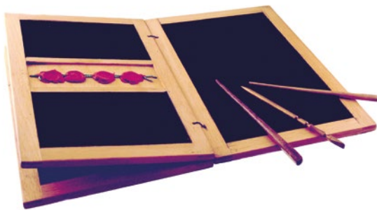
Rekonstruierte römische Wachstafel Vorgänger der heutigen Buchform.