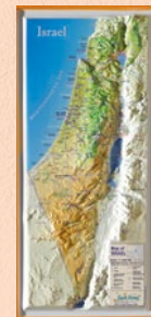
Israel – Reliefkarte